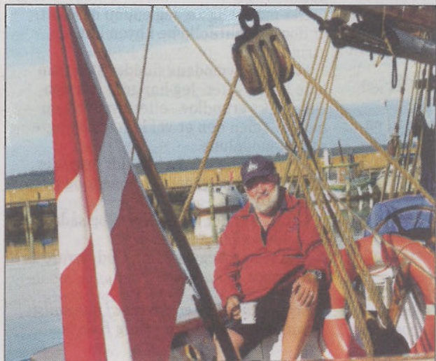
Skipperen fra Aabenraa i sit rette element - med flaget hejst, en kop sort kaffe i hånden og omgivet af sagte svulpende havvand.